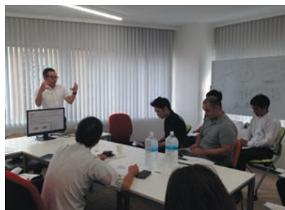
名古屋オフィスでがっつり初ミーティング

名古屋駅前 から徒歩5分の好立地に「PAL名古屋オフィス」がOPEN! 人材派遣事業の拡張と名古屋の事務拠点機能を持ち合わせ、拡大エンジンを掛けていきます。中部に物流ピックアップ(?)を起こす日も近いかも!