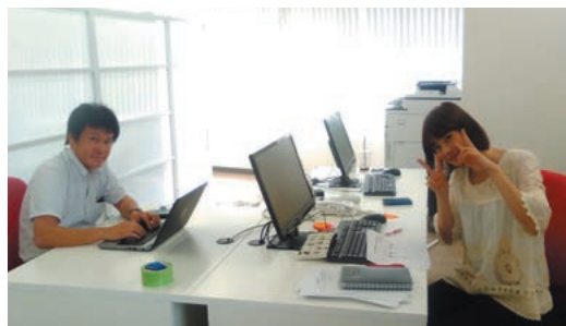
いつもおなじみの二人